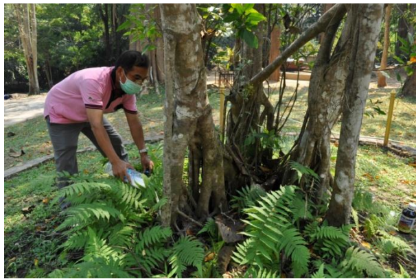
ภาพที่ ๑๐ เจ้าหน้าที่ใช้สารเคมีคลอรีไพริฟอสผสมน้ำ ราดบริเวณโคนต้น