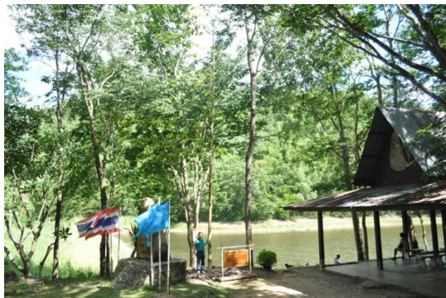
ภาพที่ ๖ ภูมิทัศน์บริเวณต้นขานาง