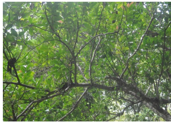
ภาพที่ ๑๒ สภาพกิ่งและใบไม่มีหนอนม้วนใบ และกาฝาก