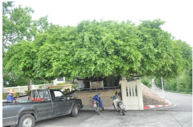
ภาพที่ ๑๘ สภาพลำต้นและใบสมบูรณ์