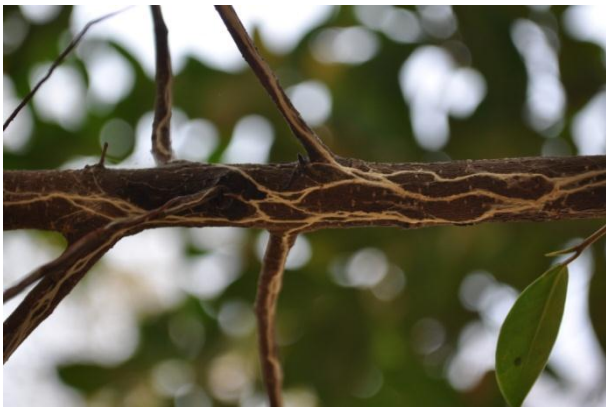
ภาพที่ ๙ มีหนอนม้วนใบและกาฝาก