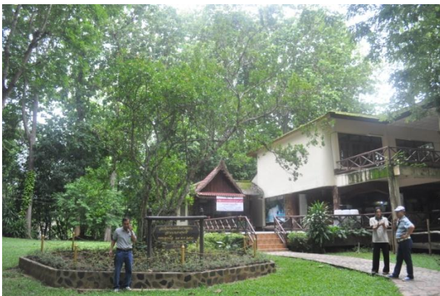
ภาพที่ ๑๑ สภาพต้นไทร