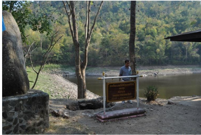
ภาพที่ ๓ ต้นขานางเกิดเชื่อว่าที่รากและปลวกกัดกินรากยืนต้นตาย