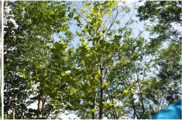
ภาพที่ ๕ ไปมีสภาพสมบูรณ์