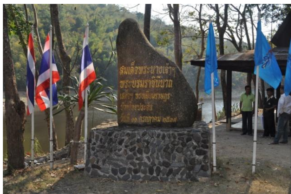
ภาพที่ ๒ ป้ายชื่อผู้ทรงปลูกและชื่อต้นไม้