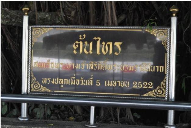
ภาพที่ ๑๕ ป้ายชื่อต้นไทรสมเด็จพระนางเจ้า พระบรมราชินีนาถ ทรงปลูกที่วัดสังกัสรัตนคีรี จังหวัดอุทัยธานี