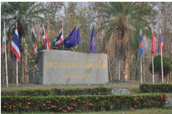
ภาพที่ ๑ ป้ายชื่ออุทยานแห่งชาติเฉลิมพระเกียรติ ไทยประจัน

๑. อุทยานแห่งชาติเฉลิมพระเกียรติไทยประจัน จังหวัดราชบุรี เจ้าหน้าที่ฝ่ายอารักขาพันธุ์ไม้ป่า ได้ไปสำรวจและบำรุงรักษาต้นไม้ทรงปลูก เมื่อวันที่ ๔ กุมภาพันธ์ ๒๕๕๘ เนื่องจากต้นขานางเกิดเชื้อราที่ รากและปลวกกัดกินรากยืนต้นตาย และเจ้าหน้าที่ฝ่ายอารักขาพันธุ์ไม้ป่า ได้แนะนำให้จัดหาต้นใหม่มา ปลูกแทน