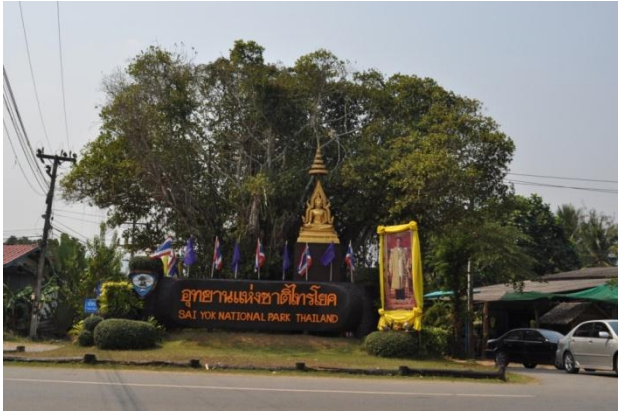
ภาพที่ ๗ ป้ายอุทยานแห่งชาติไทรโยค