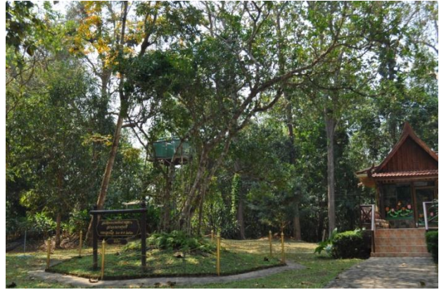
ภาพที่ ๘ สมเด็จพระเทพรัตนราชสุดาฯ ทรงปลูก