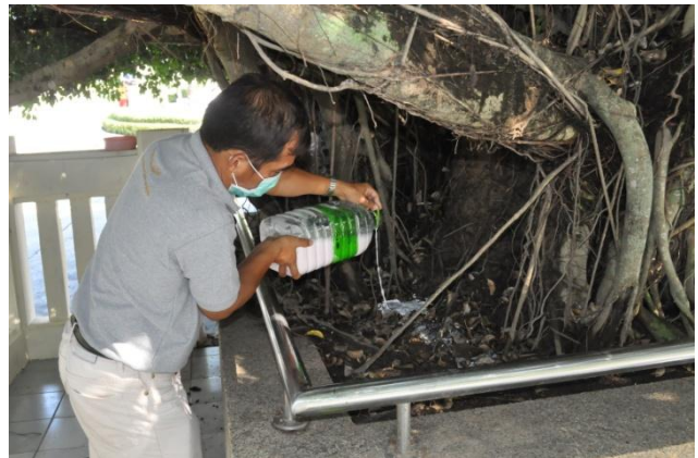
ภาพที่ ๑๖ เจ้าหน้าที่ผสมสารเคมีคลอรีนไฟฟอสกับ น้ำรดที่โคนต้นไทรและรังปลวก