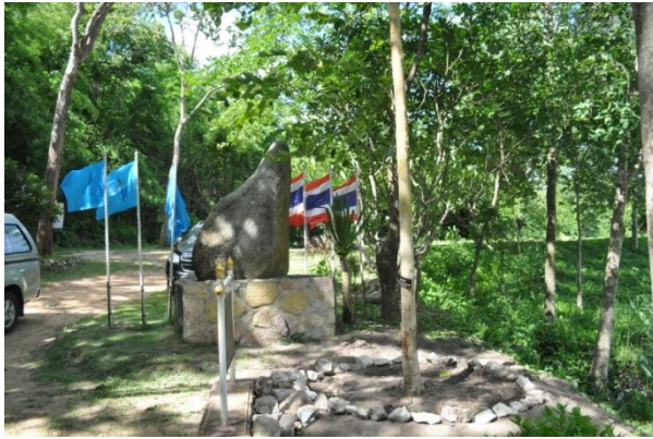
ภาพที่ ๔ อุทยานแห่งชาติเฉลิมพระเกียรติไทยประจัน ได้นำต้นขานางมาปลูกใหม่ เมื่อวันที่ ๒ ก.ค.๒๕๕๘