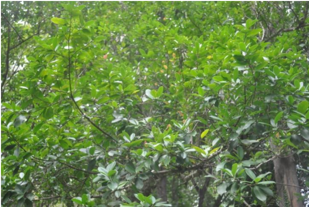
ภาพที่ ๑๓ สภาพใบสมบูรณ์